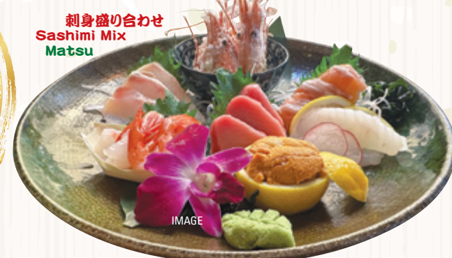
刺身盛り合わせ Sashimi Mix Matsu